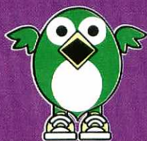
市制施行50周年記念事業 イメージ・キャラクター 「とっぴちゃん」

鳥栖の冬の夜空を彩る「ひかるフェスタTOSU」が12月1日から始まりました。会場の中央公園を約60,000個の電球でライトアップするほか、約20,000枚のCDで高さ約20mのお城が建てられました。「トゥインクルキャッスル」と名付けられたこのお城は、キラキラと七色に輝きます。クリスマスの25日まで開催中。