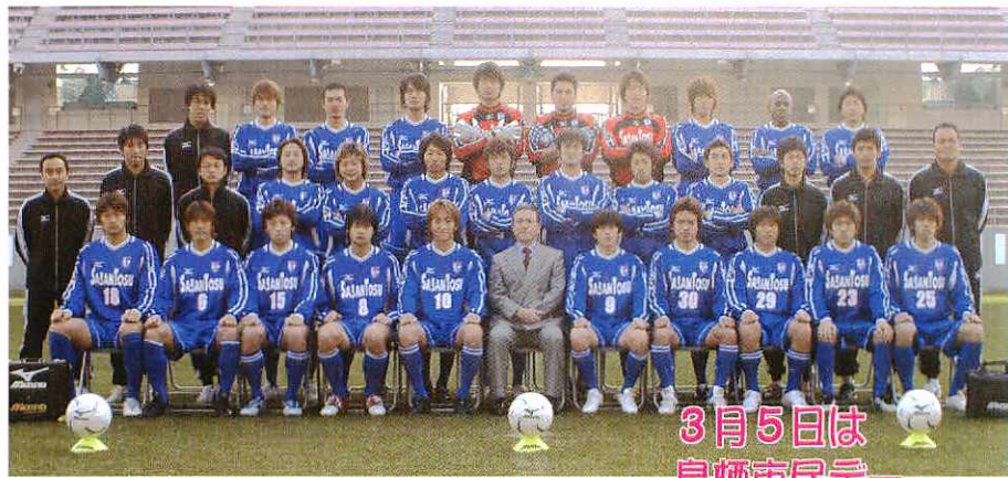
3月5日は鳥栖市民デー