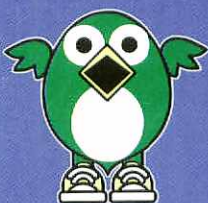
市制施行50周年記念事業 イメージ・キャラクター 「とっとちゃん」