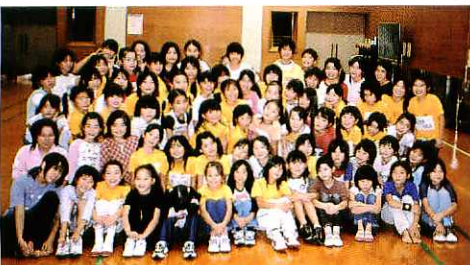
最高の舞台を目指して、厳しいレッスンに取り組むメンバー

場、同2時間開演 ところ ● 市民文化会館 入場料 ● 1000円 チケット取扱所 ● 市民文化会館、サンメッセ鳥栖ほか 託 児 ● 1人300円 (先着順) 問い合わせ ● 鳥栖子どもミュージカル実行委員会 (市民文化会館内 ☎ 85・3645)