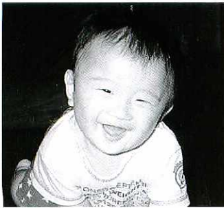
原和良さん幸恵さんの2男