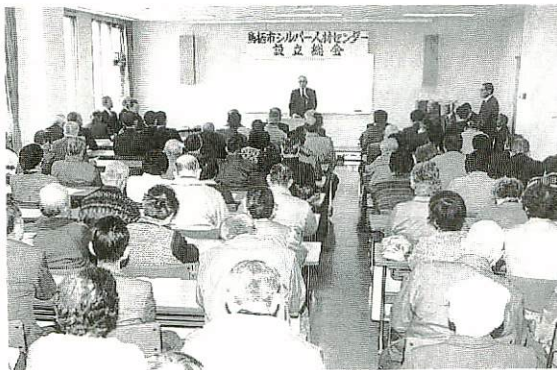
規約や事業計画などを決めた設立総会

え木のせん定、塗装、公園や庭の清掃・除草、経理、筆耕などで料金は1時間500円から900円。