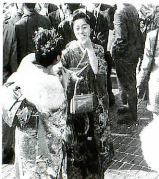
久しぶりの再会で話はずむ