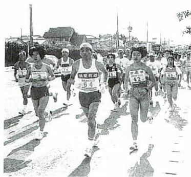
老いも若きも力走!