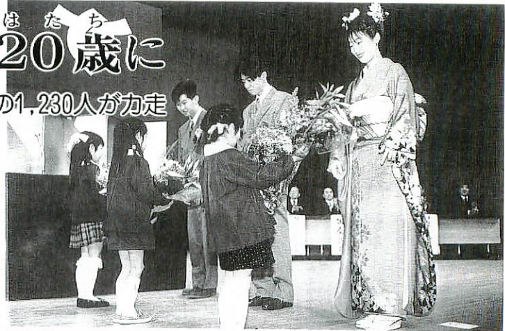
白鳩園の園児が成人代表に花束を贈ってお祝い

第30回鳥栖市祝成人ロードレース大会と第4回高校生鳥栖10キロロードレース大会がスタート。鳥栖・筑紫野バイパスをコースに1,230人の選手が力走し、沿道からは振りそで姿の新成人が盛んな声援を送っていました。成績は次のとおりです。