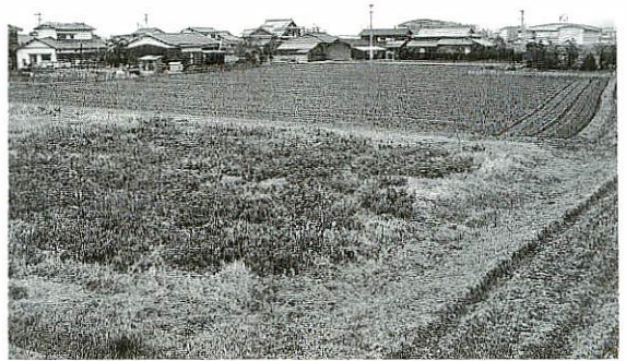
市で初の事業実施となる飯田地区

いままで家庭から出る生活雑排水が農業用用水路や河川に直接流れ込み、農業用水などの水質汚濁