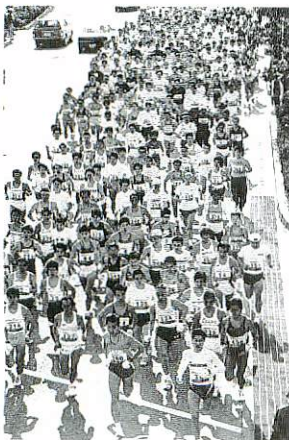
選手が一団となってスタート!