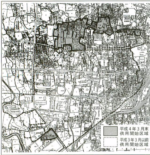
公共下水道供用開始区域図

下水道を使用されると、使用水量に応じて月々、下水道使用料をいただくこととなりますが、これ