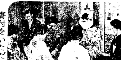
中央公民館で結婚式

結婚シーズンです。9月24日中央公民館では、閉館以来初めての公費結婚が行なわれ、