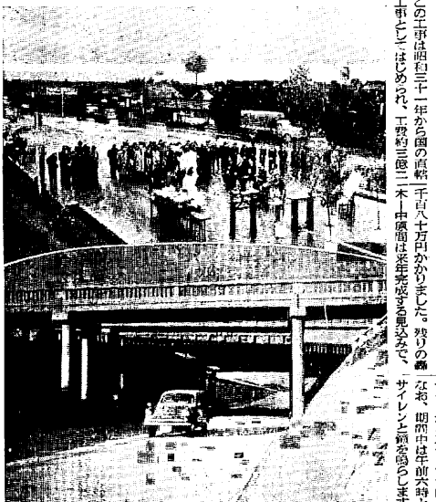
【写真上】国道3号線との分岐点で行なわれた開通式 【写真下】轟木町の長崎本線との立体交差点付近

この工事は昭和三十一年6月の精工八百四十からなりました。翌年の開通式は、工費約三億二千中、中は完成は、開通式は、