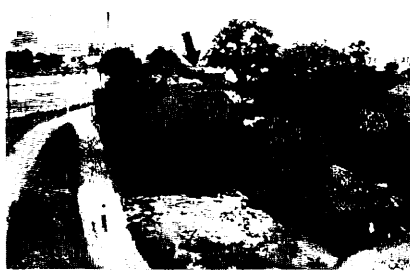
現在の下野堤防は建設中の計画で北側へ引き下げられるので、下野保育園（矢印）一帯の家が移転させられる

鳥栖市は、河決義のあらわを公表した。これは、河川の治水と防災に関する重要な資料である。このあらわは、河川の状況と治水の計画を詳しく説明している。また、市民の協力を呼びかけている。