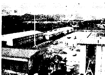
姫方町のニッカウ井スキー九州工場

姫方町の国道3号線沿に昨年の10月着工、建設を急いでいたニッカウ井スキー九州工場がこのほど完成、5月10日北海道本社の竹鶴社長をはじめ、県知事、安原鳥栖市長らが出席して盛大