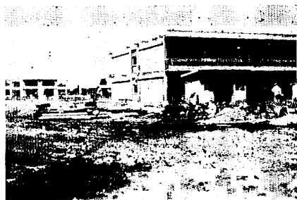
宿町の九州工業技術試験所

庁舎、恒温恒湿実験庁舎実験工場、宿舍などを建設する。今度できあがつた施設は全体の約1割程度、3年後の職員は約100人で、九州のあらゆる資源の総合開発と利用法の研究、二次産業の振興、公害対策について研究するもので、九州各県が成果を期待している。