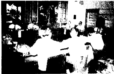
◀ 支所廃止について、参考人の意見をきく市議会総務委員会(6月24日)