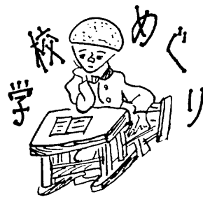
鳥栖中学校 (本町二丁目)