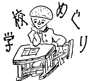
河内小学校（河内町）