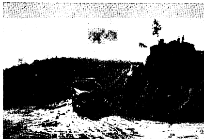
上水道の配水池工事すすむ朝日山の御野立所

朝日山と呼ばれるようになったのは、吉野時代の建武元年（約630年前）ごろ、朝日但馬守資法がここに城を築いてから、200年にわたり、