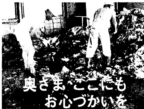
奥さま、ここにもお心づかいを

4、5年前、鳥栖中生徒の学力は県下で1、2位だった。これは学科担任教師の充実いかんが生徒の成績に影響するということだ。施設の充実もさることながら、統合によって適正規模の学校に拡大し、学科専任の先生を充実し、将来進学や職場で