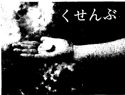
直径 4.5センチのヒョウ 山浦町