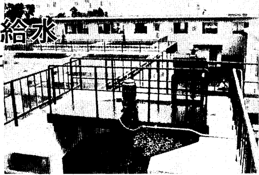
朝日山のふもとに完成した浄水場 (電話3535番)

上水道建設はこのほど第1期工事を終え、7月から給水することになった。すでに指定水道工事店も決まり各世帯の引込工事が始められている。給水申込みは水道課でいつでも受け付けているのでお早目に。