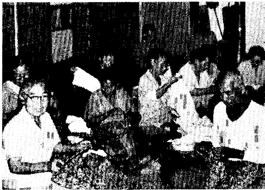
おむつづくりに励む桜町老人クラブ

同クラブは訪問に先立ち町内255世帯に呼びかけて集めた古ゆかた60枚と、おむつ約560枚をつくり持って行きました。真心の園では毎日約1000枚のおむつ使うのでたいへん喜ばれたそうです。柴藤会長は「いたれりつくせりの設備と世話で快適な暮らしのようだが、わたしたちが一人一人に言葉をかけてまわると、涙を流したり、手を合わせて拜む人もあります。やはり家族と離れていることはさびしいことだとつくづく