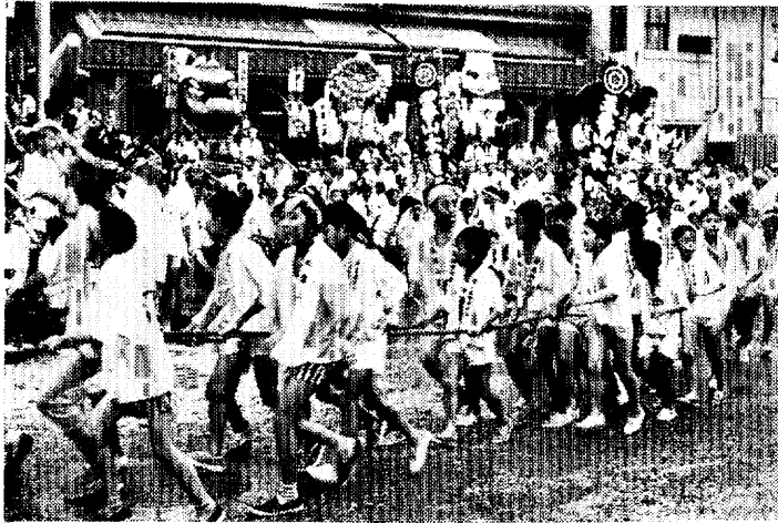
鳥栖駅前に勢ぞろいした山笠