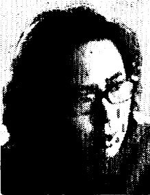
宮地さん 鳥栖市民、として誇りをもてる郷土にしたいですね

市長 今おっしゃったことは、わたし自身体験もしているし興味を持っている問題です。みなさんからおしかりを受けるかもしれませんが、公民、社会教育というのは、自分自身で行なうべきものだと思うのですよ。その場合に、指導的な立場で助言してくれる人がほしいと思いますね。池の魚が自然と「ヌクメ」の中にはいつてくるように、みんなが慕