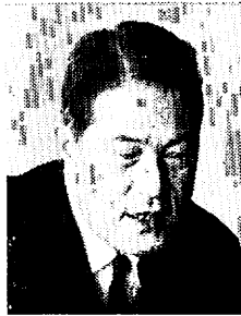
市長 緑と花、うるおいのある町づくりをみなさんと…

歴代の市長さんの力で、工場ができ、道路ができ、上水道もできました。この辺で鳥栖市も文化的なもの