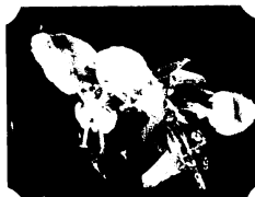
ツクサ じつりと露をあびたアイ色 に涼めいっぱい。昔、この花で布をすり 染めたという。若葉は金用、乾燥して利 尿剤にもなる。日蔭の花にしてはレパ ートリーが広い。