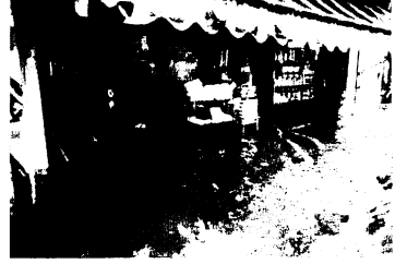
中央市場に流れ込んだ濁水

農林関係の被害額は909万5000円になりました。農地25か所、水路7か所、道路6か所、井せき1か所が法崩れ(448万円)を受けたほか、鶏舎の冠水によって鶏1500羽が死亡(67万5000円)。そ葉類および花木類も約15万円が225万円の被害を受けました。このうち農地5か所、水路7か所、道路1か所、井せき1か所の公共災害は8月24日から29日まで農林省の査定を受け、9月に復旧にかかる見込みです。このほか水田15万が流失、140万が埋