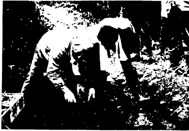
係員の指導でツツジの植付け（養父町で）

神辺町、養父町、安楽寺町、轟木町、原古賀町、宿町、山油町などの33戸は3.5㍍に街路樹や庭木を栽培することにし、4月4日第一陣の苗木を植えました。市農林課が久留米市九州植物流通センターと栽培契約を結んだもので、ツツジ、柳、桜、トウカエデ、サザンカ、ナンキンハゼなど。3年後に流通センターが引き取るが、予想では10㍍当り15万円前後に