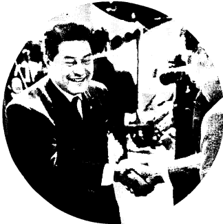
那珂川町長と開通を喜び合う原市長