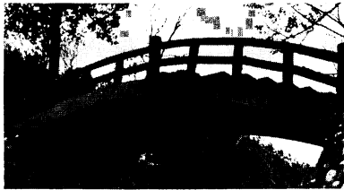
朝日山公園の園路にかけられた太鼓橋