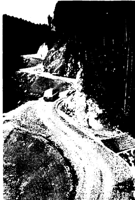
開通した峰越林道大河内線

総事業費は約8452万円(佐賀県5312万円、福岡県3140万円)で、佐賀県側の65.8%は国庫補助、21.5%は国有林負担、9.9%が県負担、鳥栖市は2.8%に当たる404万円を負担しました。近くには九千部山、河内ダム、南畑ダム、筑紫耶馬溪などがあり、観光面でも貢献する道路になりそうです。