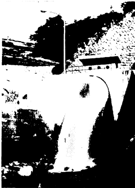
放流口から毎秒23.5立方メートルをはき出している