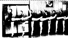
バレエ教室のレッスン風景

は雨の日曜も多いことから、ゆっくり図書館で読書などいかがでしょう。開館時間は午前9時から午後4時までになっています。