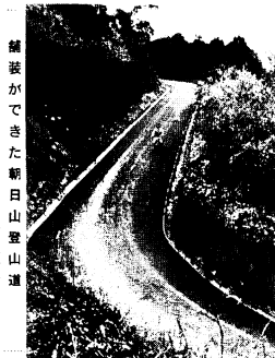
舗装ができた朝日山登山道

遊具や木をきずつけないようにいたしましょう。また遊歩道にバイクを乗り入れて遊んでいる人がありますが、危ないうえに道がいたみますので止めてください。