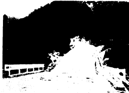
舗装を待つ終点金の水付近 (十番目橋から3月22日撮影)

みかん山への往復が便利になるだけでなく、終点の金の水から、おちょうずの流までは徒歩で20分。ハイキングも快適になりました。