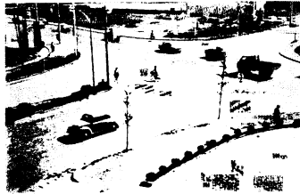
市役所前交差点に信号機

市役所前の四つ角に信号機が建てられ4月6日から点灯しています。信号に従って必ず歩道を横断してください。ただし中央公民館寄りに歩道はありませんので、ここは渡れません。