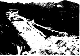
ハイウエーの建設で生活の広域化はますます強まる。 (市内柚比町から基山に向け、工事中的) (建築界パピバス)