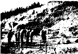
火葬場の建設場所は、美しい自然にかこまれている(写真は起工式)

焼却炉は江口式重油火葬炉で、消臭、消煙装置があり、同社の説明によると、ほとんど煙は出ず、一体を焼くのに約90分かかるとのことです。47年4月には