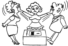
鳥栖市選挙管理委員会

市内に住んでいる人で市内のほかの町に転居した人の場合、5月20日までに市民課で異動届をした人は、新住所地の投票所で投票できます。5月21日以降の場合は、旧住所地になりますのでご注意ください。