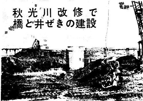
建設がすすむ川口橋

46年度の秋光川改修工事で、酒井東町地区に川口橋(こうぐち)架橋と川口ぜき(堰)建設が行なわれています。工事者は建設省筑後川工事事務所。川幅を47%に広げて堤防を作り直しますので、従来の川口橋と三太郎橋をとりこわし、新しい川口橋をかけるものですが、長さ48%、副6%のコンクリート橋。中央に大きな橋脚がある水平橋になります。事業費は4700万円。