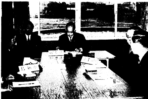
しっかりとのみす (2月16日市役所で協定に調印)