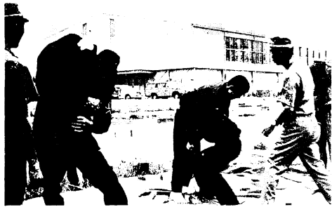
8月20日午前7時から正午すぎまで、鳥栖西中学校で、市消防団員および署員の夏季訓練があり、服装や機械器具の点検はじめ、訓練礼式、ポンプ操法、救急法などが行なわれました。夏季訓練は、炎天に負けない消防精神を養おうと、ここ10年ほど続けられているもので、この日は消防署員全員38人と消防団員259人(全員が339人)が参加しました。今回はとくにホースの結合のしかた、ホースの延ばしかた、吸水管の扱いかた伝令の伝達のしかたなど、改正点を署員が指導しながら訓練が行なわれました。