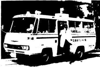
活動を待つ新しい救急車

あり、規約によると組合 の議会議員は定数13人。 鳥栖市以外の5町村はそ れぞれ町長と議長の2 人づつ、鳥栖市は市長と 議長のほかに市議会の議 員1人が選出されます。 また執行機関の長(管理 者)は鳥栖市長、副管理 者は関係町村の長の中か ら組合の議会で選挙、収 入役は鳥栖市の収入役を あててのことになっています。また組合 に、組合議員および関係市町村の監査委 員(知識経験者)のうちからそれぞれ1 人を選んで監査委員とすることになって