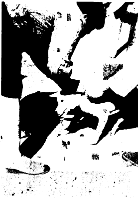
狂犬病予防注射も必ず (写真は田代公民館で)