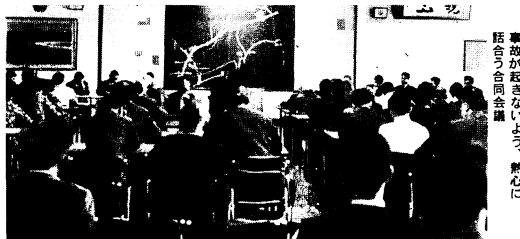
事故が起きないように、熱心に話し合う合同会議