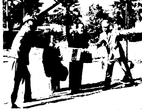
(上)「信考をよく見て……」 大会会場前では交通安全教室も (下)会場いっぱい元気な顔