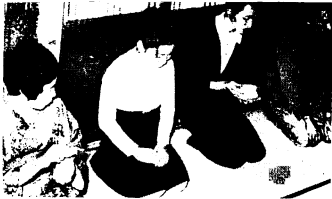
産るのはが手。でもお茶の静かなふんい気はいいですね