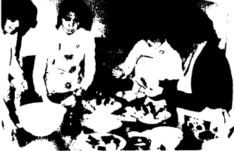
おいしい料理で彼のハートを……