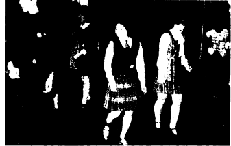
社交ダンスも紳士、淑女のたしなみ。スロー、スロー、クイック