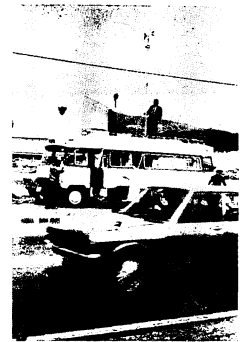
市役所前で大気のごよれを計る 県の大気環境測定車

公社鳥栖工場前で測定をする予定です。大気汚染については、この測定車が市内を巡回するほか、市内では常時、市役所別館、鳥栖電報電話局、田代小学校、浄水場の屋上で、いおう酸化物、降下ばいじんの測定を行なうほか、曾根崎派出所内に一酸化炭素測定器を置いて測定しています。