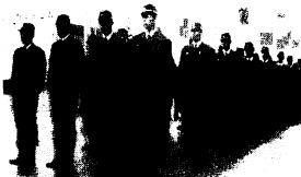
消防士のタマゴたち。先輩の前で緊張のおももちです。

10年間出入れをしない郵便貯金は昨年1年間で9億1500万円にものぼり、これらは国の収入にくり入れられました。郵便局では通帳が無効になる前に通知を