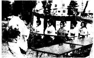
野だでもあり、国道を通りかかった外人さんのぞいていました。

にきてみますと、「これまでわざわざ中央公民館まで出かけたことはない。きょうは買物つりに寄った」と話していま