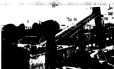
ベルトコンベアで運び上げられたガラスは、砂のようになっています。

燃えないゴミを処理する機械が、市のゴミ収集を委託している環境開発総合センター(轟木町)内に設置され、11月から運転を始まりました。機械は金物類を押しつぶす圧縮機とガラス類を粉々に砕く破砕機。両方で電気工事等をふくめておよそ85万円でした。