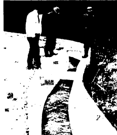
日住対策をより一歩進めた水路(原古賀町)

市は47年度の日住対策水路工事をこのほど発注しました。今年度の水路延長は1万2666米。施工場所は、原古賀町、幸津町、轟木町その他で12工区にわかれています。事業費予算はおよそ7602万円。国、県、市でおおの3分の1づつの負担になっています。