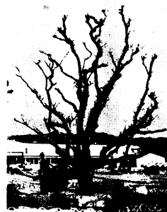
早く元気になっておくれ。(市役所前のサルズベリ)

いよいよ年末。除夜の鐘をきく前に、市税、住宅使用料、水道料の納め忘れはないかお確かめください。