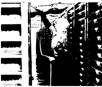
カイコだのような緑化室で1日2回散水する

同センターの「製造能力」は、1回転28分。市内の田植時期から見ると、4回転、およそ110分が限度とされています。種子消毒やたねまきなどの作業には10人ぐらいの人手を要しますが、発芽のあとは1日2回の散水だけです。10センチ当たりの苗16箱をつくるのに、労働時間は1.2時間程度ですむという計算になっています。苗は1箱190円、10分を3040円で農家におけることになっています。