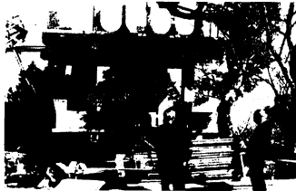
展望台工事すむ 朝日山の頂上で、3月末完成目ざし展望台建設が進んでいます。47年度で同展望台は終わりますが、みんなの公園ですから大事に守っていきましょう。