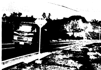
萱方町の宅地造成の土砂は、同町内バイパス横の小山から

萱方町の市営住宅建設用地の横で、県住宅供給公社が1月末から宅地造成工事を始めました。盛土用の土砂は、およそ1㎢北方の萱方町の小山から運んできていますが、土砂を満載すると総重量20tにもなるダンプによって、厚さ4層しかない簡易舗装の市道が相当破損すると考えられます。このため市は、運搬に当たる今泉組および寺崎組(中原町)と話し合い、運搬回数は1日1台につき30回以内とし、破損箇所はもとどおりに直してもらうことを取り決めました。また学生の交通安全を期し、朝の通学時間を避け、運搬開始は午前8時とし、出入り箇所は