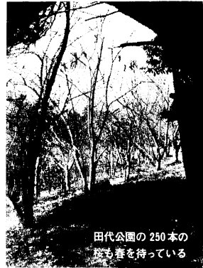
田代公園の250本の桜も春を待っている

最近の青少年の犯罪は、万引き、自転車・バイク盗みからシンナー遊び、婦女暴行など広範囲にわたります。春は特に青少年にとって進学、進級、就職の時期で、環境の変化が激しく、心が動揺しがちなときです。それだけに、子どもの行動に細心の注意をはらい、できるだけ親子の対話を増やしたいものです。