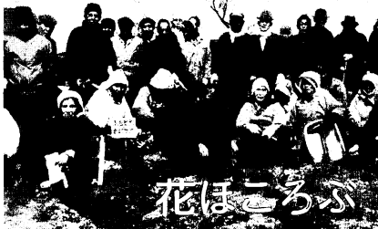
春風にさわられて、パンジー、キンセンカが顔をのぞかせ始めた3月13日、老人クラブ連合会の花壇では、およそ100人の会員のかたが草取りや肥料やりに精を出しました。