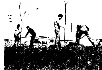
処理場も植樹で美化