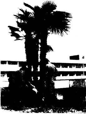
鳥栖西中に預けられたシュロ