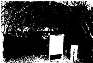
公認コースのスタート地になった田代公園 看板にはコース図と注意が書かれている