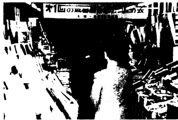
商店の意欲みせたお買上げ会風景

円の取引があったもよう。その後も商店へ注文があっており、最終的には2000万円くらいになるのでは、と商工会議所ではいっています。これに合わせて包装紙も、鳥栖にちなんで鳥をデザインした明るい色合いのものを新調し、熱意のほどを見せています。