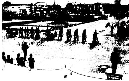
入場行進する消防団員

書と誓約書をおえてください。 ■申込資格 (1)住宅に困っており、同居またはこれから同居する親族のある人。(2)市内に住んでいるかまたは市内に勤務場所のある人。(3)所得による制限がありますが、1月1日から多少変更がありましたので、係へおたずねください。 建設課住宅係☎3111、内線231