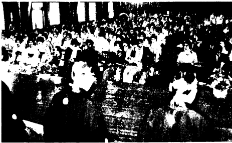
お祝いの謡曲を聴く新成人たち