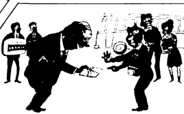
町内会などの団体旅行の際、お土産やお酒をもらったり、バス代などの費用を負担したりすること

公職選挙法が改正され、10月1日から施行されました。有権者として、次のごときは用いず、さびしい選挙をせうがましよう。