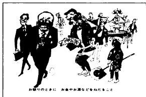
選挙戦のときに、お金やお土産などをもらうこと