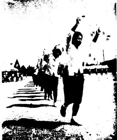
“国体音頭”も花そえる