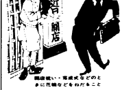
高級旅館、高級ホテルなどの豪華な花輪などをもらうこと