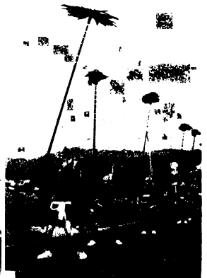
海外協力隊派遣 ●問合せ 農林課農政係 ◎3111内線 245