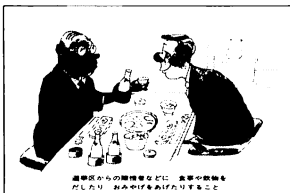
選挙区からの陳情者などに、食事や飲物を出したり、おみやげをあげたりすること