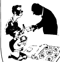
出陣、入陣、卒業、就職などのお祝いに、お食事やお酒をもらうこと