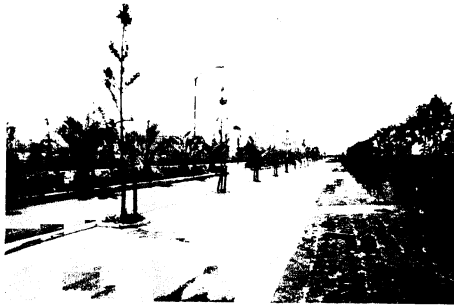
公園の中央道路から体育館を望む

秋の若楠国体でバレーボールの精鋭を迎える市民体育館は、周辺の公園工事が着々と進み一段と近代的なよそおいを見せてきました。市民公園造成は、48年度から54年度まで7か年に、総事業費約18億円を投じ、約6万6000平方メートルの公園を完成しようというものです。今年度は、総事業費6000万円が広場、自転車置場、屋外バレーコート、植樹、芝張り舗装などを行っています。