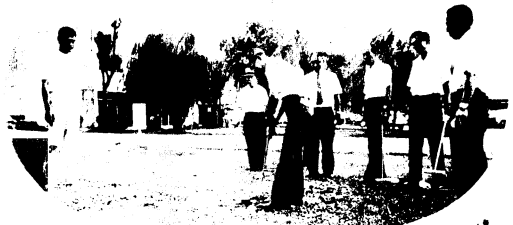
ゲートボールは、いかだ

ゴルフ?と見えるこのスポーツは、ゲートボールといいます。たて15㎝、よこ20㎝の平らなコート内に第1から第3までのゲート(門)とゴールポール(棒)を設け、木製の直径7.5㎝のボールをスティックで打ちながらコースを回るゲーム。