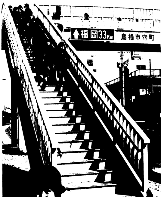
新入学、新入園児には、正しい交通のルールを身につけさせよう