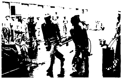
負傷者は無事に救い出され、応急手当てのうえタンカーで運ばれる

アパートへの立入り検査から、消防署では、次のような点を一般家庭で注意するよう望んでいます。