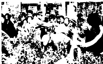
Aコープ前での苗木配布