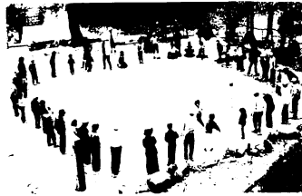
四阿屋ではゲームも

ケヤキ(蔵上町、老松神社) 新芽を伸ばそうとしているケヤキ。 この木特有の樹冠の広がり、大きな樹周、繊細な枝先をもつ素晴らしい木です。推定樹齢250年、樹周4.42m、樹高25m。