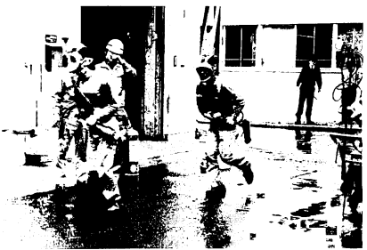
負傷者が出た！と防毒マスクを着けて救出に向う

去る2月29日から3月13日まで、全国で春の火災予防運動が行われました。この間、鳥栖、三養基地区消防署および鳥栖市消防は、バスの立入り検査、中高層住宅の立入り検査および特殊防火対象物（工場など）にたいする消防訓練の指導など防火にたいする関心を高める活動を行いました。