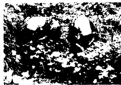
わさび床からの若葉つみ

ところがこのわさび、産地は九千部の北麓帯の隣県福岡は耶珂川町の溪流。かすりのモンペに白いスカーフ姿のおさび売りたちがフコを担いで河内峠越えに鳥栖を訪れ、「ワサビよござっしょ」と呼びかける姿は、春の風物詩でしたが、今ではマイ・カーで、八百