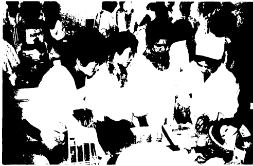
麓公民館での国体食調理の様子

鳥栖市で開催されるバレーボールと馬術競技には選手、監督、役員等およそ1500人が参加する予定ですが、これらの人々の宿泊はすべて鳥栖市で引受けられています。