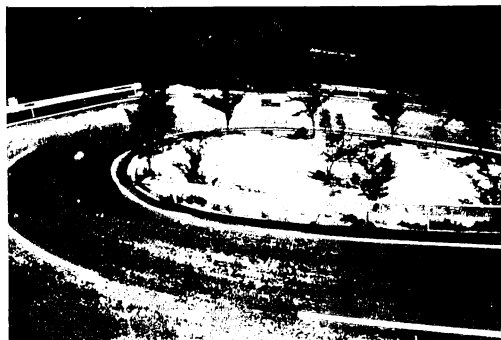
拓子が峯登山人口付近