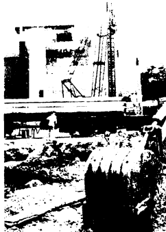
鳥栖小の改築現場(8月3日)

新設小学校・基里小学校の校舎建設工事はとす市報7月11日号でお知らせしたとおり、6月23日に着工しましたが、さらに基里小学校改築(第3期・第4期)および鳥栖小学校改築(第2期)工事も、夏休みにはいるとすぐ着しま