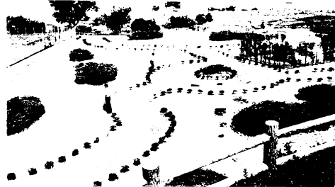
朝日山中腹に増設した配水池の上は遊歩道もでき、周辺も一段と整備されました。(52年4月完成)

安楽寺町)、導水管布設、送水管布設、沈殿池、および配水池築造、配水管布設工事等を約19億8000万円で完了しています。安楽寺町の取水場からはすでに51年4月1日から取水しており、第二浄水場に導かれた原水は、沈殿池を通ったあと第一浄水場に送り込まれて、ろ過処理等を行い、朝日山の配水池へ上げています。ノ