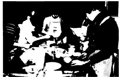
おいしそうなニオイに、おなががりそう

火曜日・祝日・8月15日(盆)および年末12月29日～年始1月3日となっています。利用料金は無料で、鳥栖市内居住または市内企業で働く25歳未満の勤労青少年が利用できます。