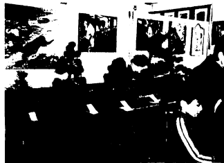
農の文化祭 ほんの一部しか紹介できないのが残念です