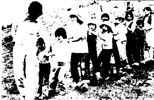
● 創作した物語（太古村）