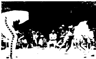
▲「ワタチニモ、ウツセマチュ」(杓子ヶ峰で) ▼ハッケヨイ! (田代公園で)

り」を出版し、200円で販売しています。御希望のかたは、元町・鳥栖商工会館内の青年会議所事務局へどうぞ。 また、田代公園内の太古村は、約1か月間保存し、見学できるようにしています。