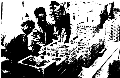
12月中旬から市内で生産されたイチゴ等の香の農協地支所での集荷風景