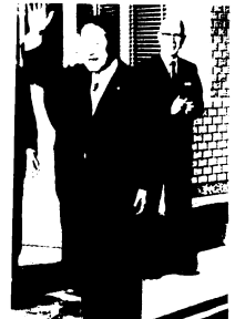
市職員の出迎えにこたえる市長 (1月25日、初登庁)

栄えある3期目の鳥栖市長就任にあたり、謹んで市民の皆さまに、ごあいさつ申し上げます。