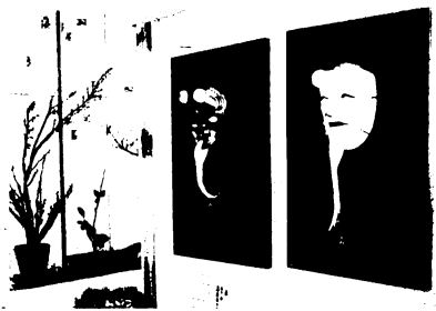
格調高い「能面」も出展された基里地区文化祭

自分たち年寄りの出る華はないが、文化祭には出品できると……」。この言葉どおり、70代、80代の書や手芸が人々を感心させていました。