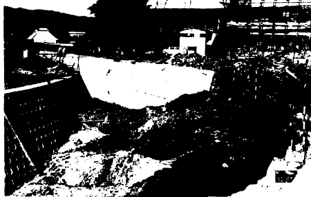
▲51年度建設の校舎に連結して工事の新たなコースを築いた轟木川(従来は、右下石がきの前を流れていた)

は、校舎建設と並行して県により改修が行われ、コースを西よりに変えました。市は、鳥栖小のほか、若葉小新築、基里小改築(第3期)も同時に進めており、いずれも新学期前の完成を急いでいます。